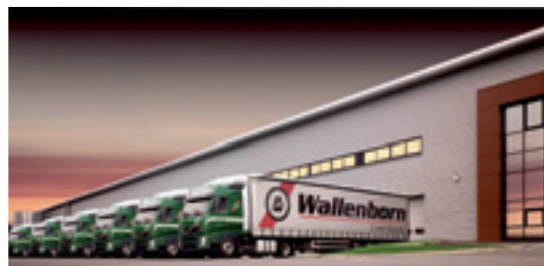
Hauptsitz der Firma Wallenborn in Luxemburg. Die moderne LKW-Flotte.